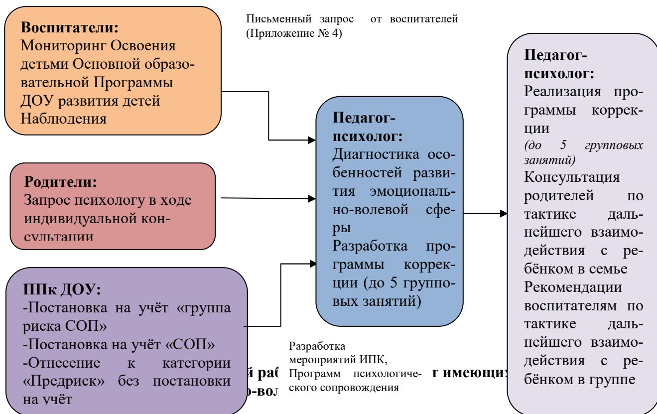
Психологическая коррекция детской гиперактивности

Алгоритм выявления детей, имеющих нарушения развития эмоционально-волевой сферы, и организации коррекционно-развивающей работы с ними