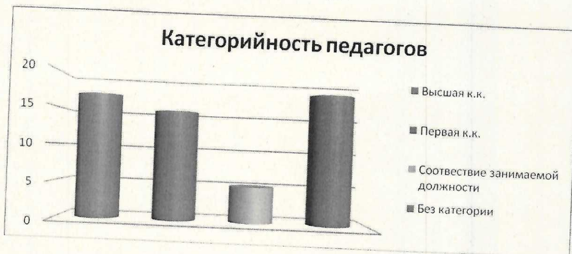
Диаграмма с характеристиками кадрового состава